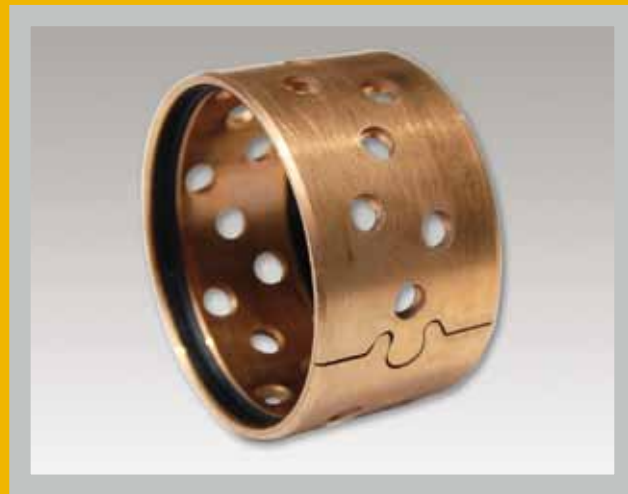
GEROLLTES BRONZEGLEITLAGER, LOCHDEPOTS, DICHTUNG, WARTUNGSARM